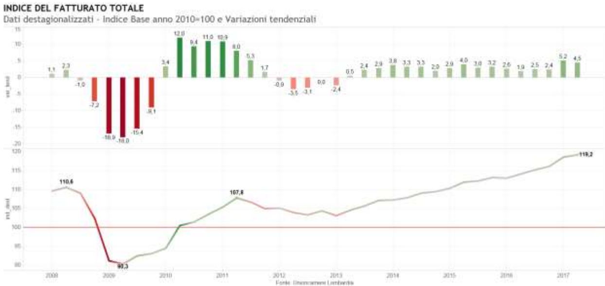
Grafico 2: Fatturato totale

Nota: L'aggiunta di una nuova informazione porta ad una stima migliore del modello di destagionalizzazione e correzione per i giorni lavorativi e quindi alla possibile revisione dei dati già pubblicati.