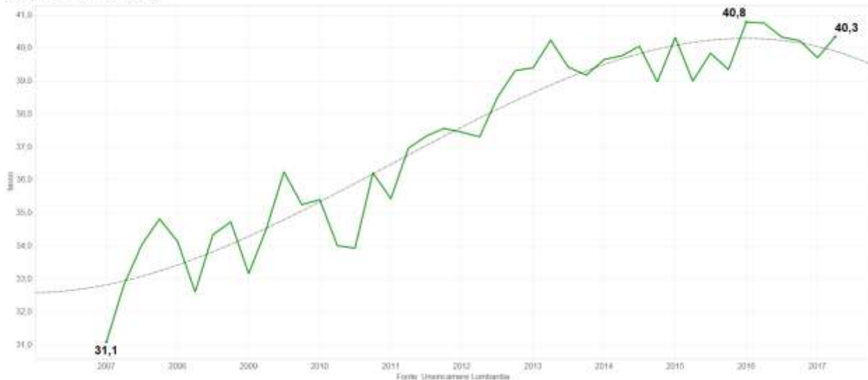
QUOTA FATTURATO ESTERO SUL TOTALE Quota e linea di tendenza